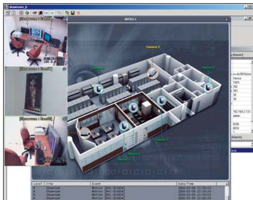
Rys. 3. Mapa obiektu z podglądem obrazu z kamer

Dostarczane wraz z urządzeniem zaawansowane aplikacje sieciowe umożliwiają budowę centralnych stacji monitorowania, zdolnych do nadzoru i podglądu obrazów z kamer z wielu lokalizacji rozproszonych. Możliwość zdalnej konfiguracji oraz monitorowania stanu pracy urządzeń pozwalają na wyeliminowanie lokalnej obsługi i skupienie wszystkich funkcji zarządzających